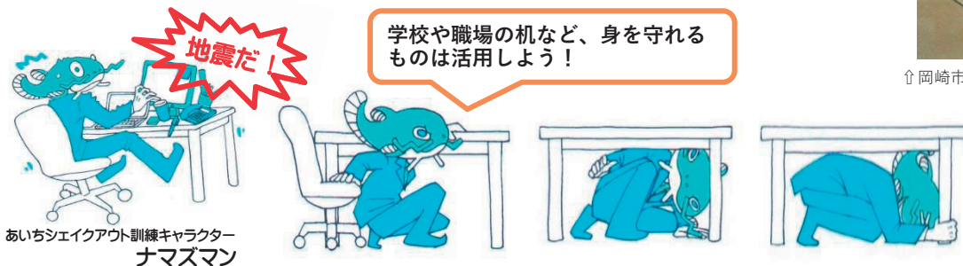
あいちシェイクアウト訓練キャラクター ナマズマン