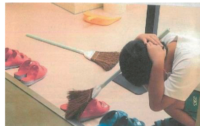
↑岡崎市立下山小学校でのシェイクアウトの様子 (2022年)